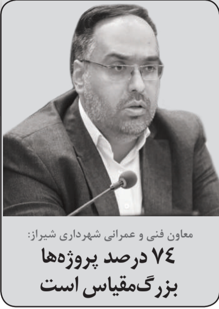
معاون فنی و عمرانی شهرداری شیراز: ۷۴ درصد پروژه‌ها بزرگ مقیاس است