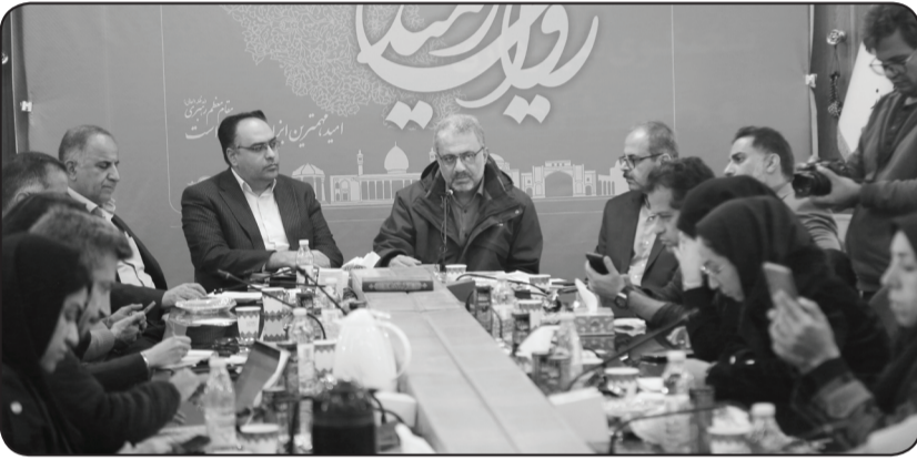
اجداد سالن همایش هزار نفره