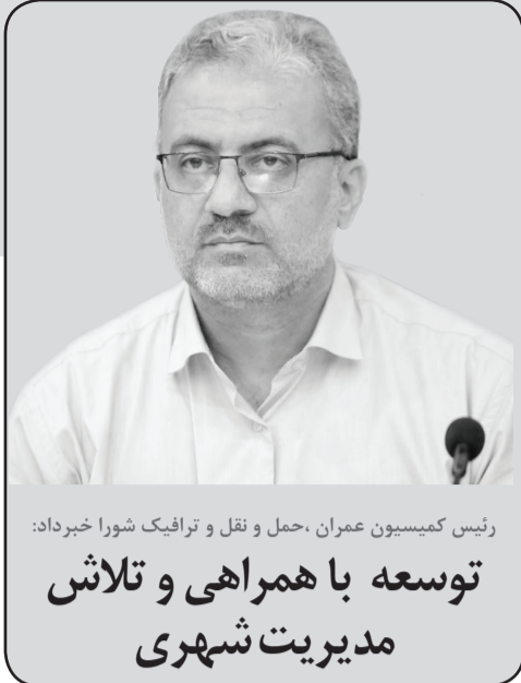
رئیس کمیسیون عمران، حمل و نقل و ترافیک شورا خبرداد: توسعه با همراهی و تلاش مدیریت شهری